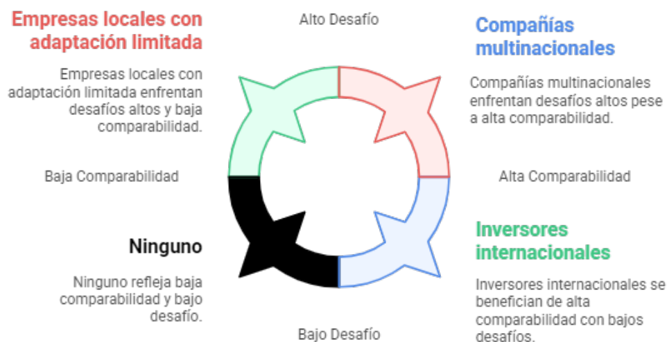
Figura 1 Impactos y desafíos de las NIIF

No obstante, aunque la estandarización contable bajo las NIIF ha mejorado la comparabilidad de la información financiera, existen desafíos en su aplicación práctica. Algunos estudios han señalado que la interpretación de ciertos principios contables puede variar según el contexto económico y regulatorio de cada país, lo que podría limitar la plena convergencia de la información financiera a nivel internacional (Glaum, Schmidt, Street, & Vogel, 2013). En este sentido, la capacitación de los profesionales contables y la armonización de las normativas locales con las NIIF son aspectos cruciales para maximizar los beneficios de la transparencia y comparabilidad que ofrecen estos estándares.